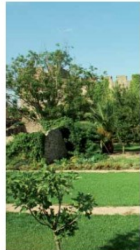
Hort del Prior