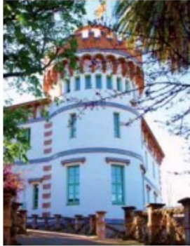
Torre d'en Reig