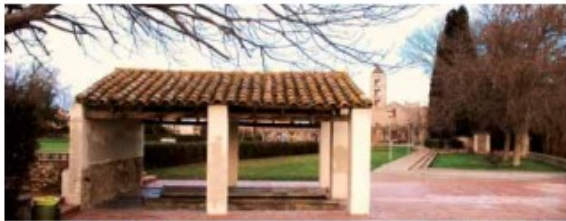
Font de l'abat Rigau i Safareig

La Torre d'en Reig, amb elements que emulen la natura i amb reminiscències de fortificació medieval, té moltes semblances amb la casa forestal de Sant Martí d'Empúries. Consta de planta baixa, dos pisos, golfes i una torre. Els mobles havien estat dissenyats especialment per a l'edifici seguint l'estil modernista.