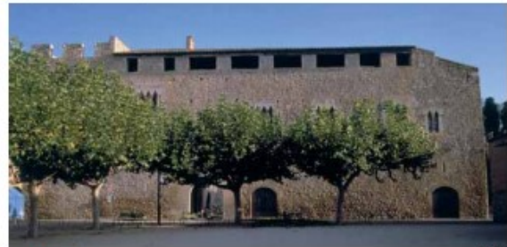
Palau de l'abat

A partir d'aquell moment l'arquitectura gòtica va passar a ser un fet urbà, estenent-se per tota la geografia catalana. Aquest palau és una bona mostra del gòtic civil català. Es van respectar algunes arquitectures preexistents, com ara l'antiga hostatgeria romànica, a la planta baixa. Pel que fa a la façana, veiem una gran porta d'accés adovellada i coronada per una fornicula gòtica amb una escultura que representa una Mer de Déu. A sobre de la dovella central hi ha un relleu de sol i el que podria ser l'escut de la família nobiliària de l'abat Girgós (a qui s'atribueix la construcció del palau al segle XV). Podem veure també els finestres gòtics trifors (dividits en tres parts), excepte a les finestres de ponent, que són geminades. Totes tenen els arquets de forma trilobulada amb columnetes i capitells de pedra calcària de Girona, amb una decoració floral i vegetal típica del gòtic català.