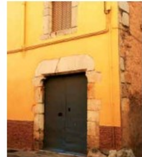
Carrer dels Comoners de Castella

podem contemplar un altre portal adovellat i una finestra geminada amb arquets de forma trilobulada i decoració floral, com les finestres de la façana sud del palau abacial. Finalment, si enfilem a la dreta el carrer de l'Empordà i tombem a l'esquerra, al carrer dels Comoners de Castella trobem una casa amb un portal de carreus i una finestra amb les mateixes característiques que l'anterior.