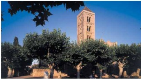
Exterior de l'església