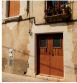
Carrer de Santa Maria

Tot passejant pel poble podem identificar alguns elements arquitectònics procedents de l'abadia integrats en cases de gestió privada. De tota manera, l'Ajuntament de Vilabertran, mitjançant el Pla de Protecció i Dinamització del Patrimoni Cultural del 2006, ha catalogat tots aquests elements com a Béns Culturals d'Interès Local, de manera que gaudeixen d'una protecció parcial.