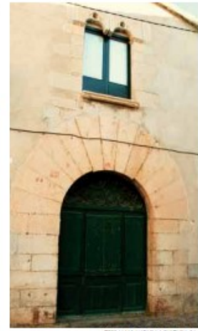
Plaça del Doctor Heras

podem contemplar un altre portal adovellat i una finestra geminada amb arquets de forma trilobulada i decoració floral, com les finestres de la façana sud del palau abacial. Finalment, si enfilem a la dreta el carrer de l'Empordà i tombem a l'esquerra, al carrer dels Comoners de Castella trobem una casa amb un portal de carreus i una finestra amb les mateixes característiques que l'anterior.